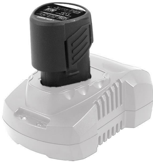
※充電器は、別売です。

この度は、アストロプロダクツ製品をお買い上げいただきまして、誠にありがとうございます。